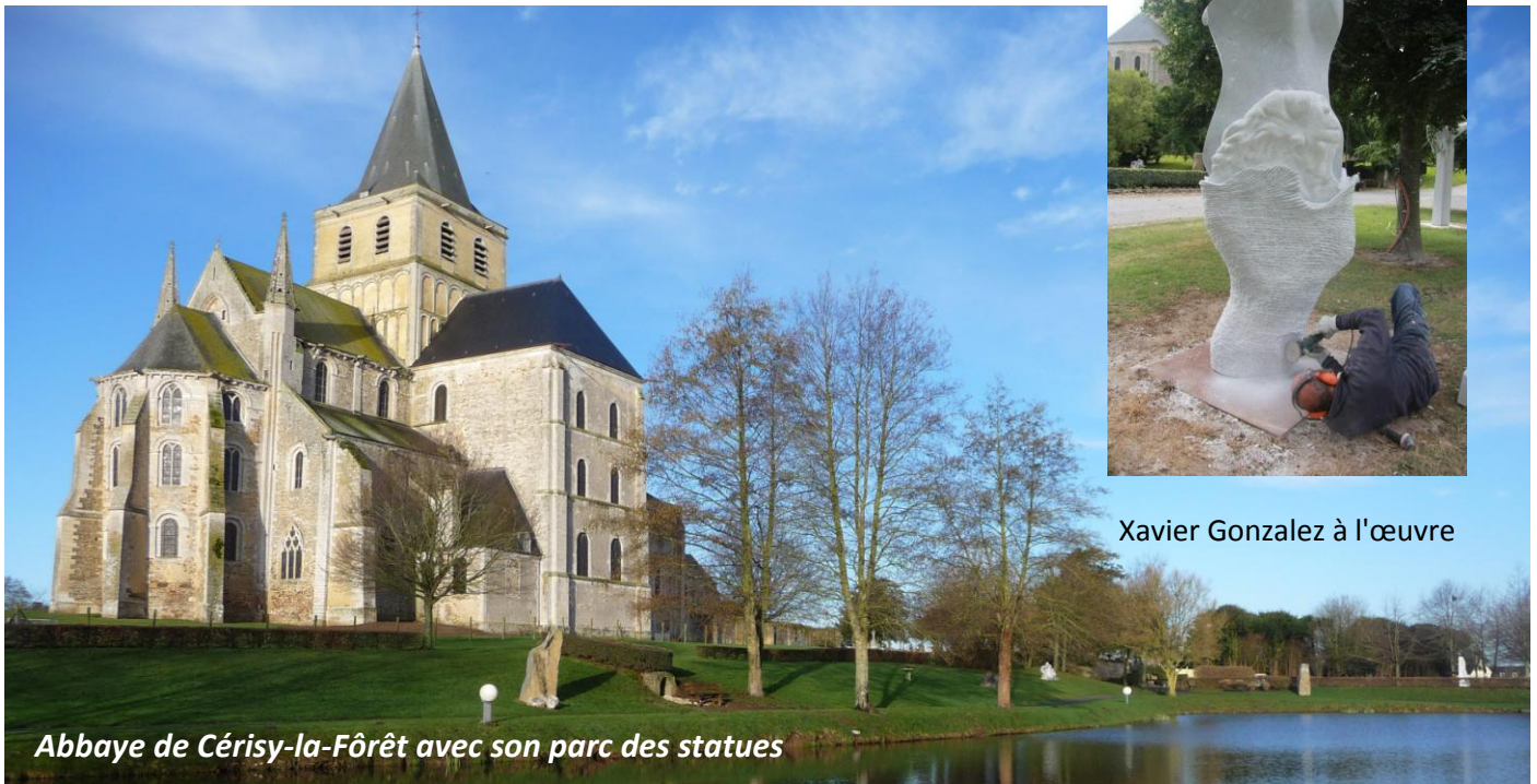
Xavier Gonzalez à l'œuvre