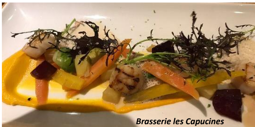
Brasserie les Capucines

Menu du jour, vin et café à 29€. Chacun paiera le forfait sur place.